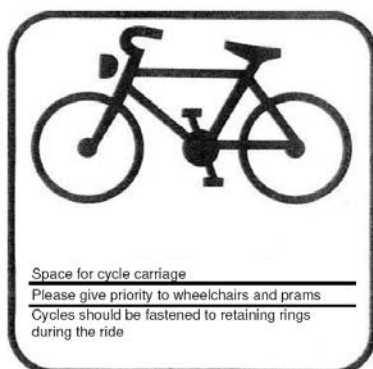
Exemples de pictogrammes pour fauteuils roulants et vélos (base de travail)