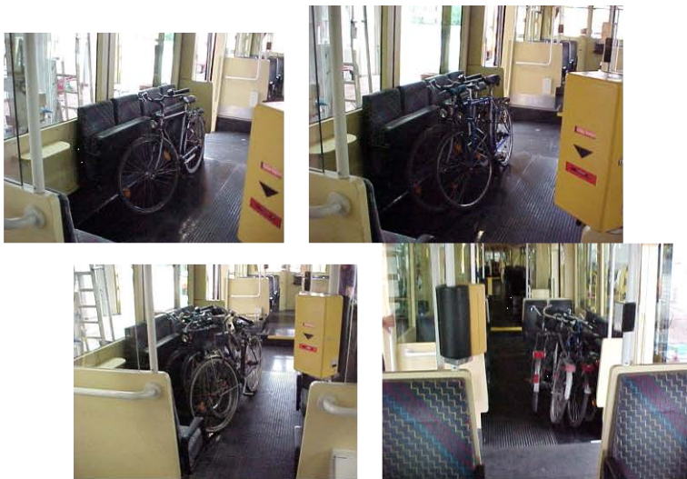
Exemple de transport de vélos à Karlsruhe.