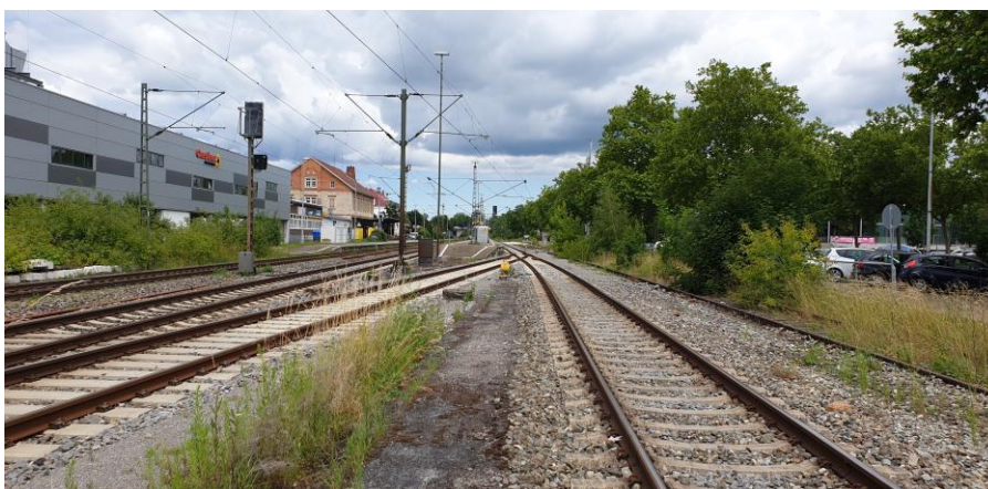
Bf Metzingen (Neubau Bahnsteig, Gleise und Weichen)