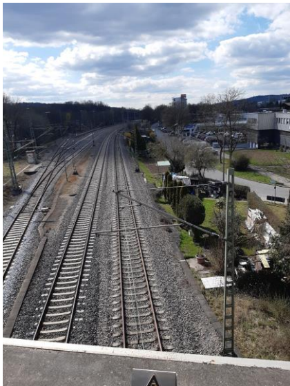
Neckaraue (Gleis und Weichenumbau)

Die TTK erstellt als Generalplaner der Gesamtmaßnahme die Planung der Verkehrsanlagen.