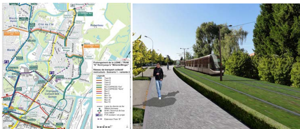
Le projet : réorganisation du réseau de bus, photomontage