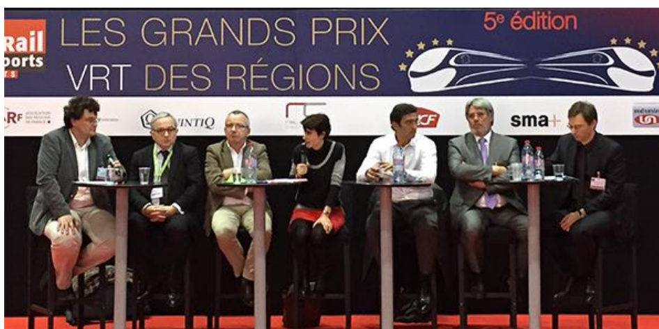
Un dispositif sur lequel TTK a travaillé, qui a été primé au Grand Prix VRT (Ville, Rail&Transport) des Régions 2015, Thématique Intermodalité